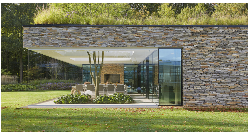
Glazen vouwwand: Metalura, Alblasterdam

Leverancier bomen en planten: Boomkwekerij Ebben, Cuijk