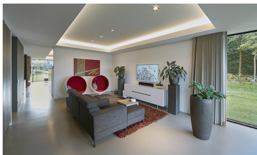
Gordijnen: Schoone WOONwensen BV, Zevenbergen

gelijkvloers wonen. Dat is erg prettig in ons gezinsleven met twee kinderen. De plattegrond heb ik een open karakter gegeven met lange zichtlijnen, zodat je vanuit de verschillende ruimtes met elkaar in verbinding blijft. De ruimtes worden op subtiel wijze ‘afgebakend’ door in het plafond te spelen met diepte. Daarnaast wilden we dat alles een hele strakke look & feel zou krijgen. Het vaste meubilair is op maat ontworpen en gerealiseerd, zoals de vele inbouwkasten. Nergens in en om de woning zijn bovendien afwerkrandjes te zien. Juist die details maken een groot verschil in de totale uitstraling.”