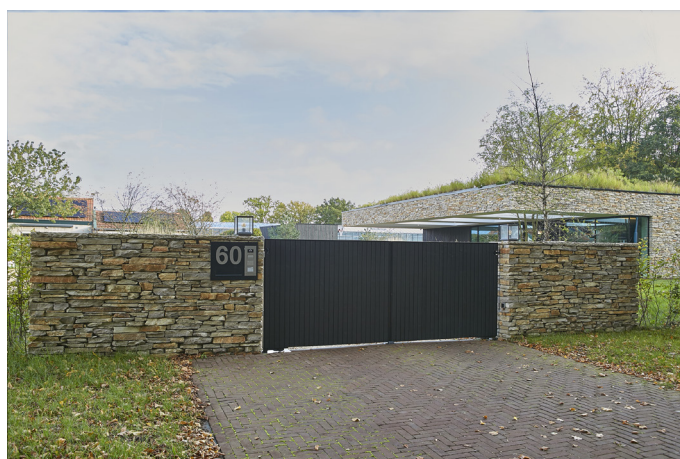
Poort: DJS Hekwerken, Vuren